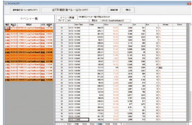
イベントウィンドウ